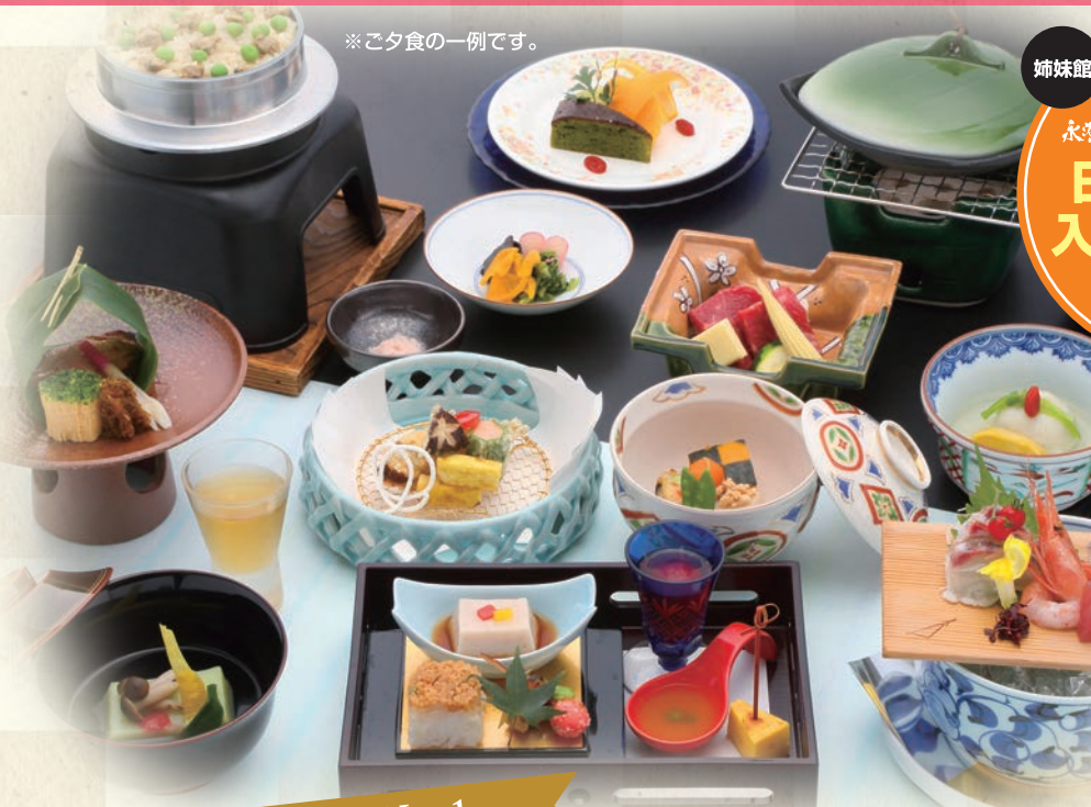
※ご夕食の一例です。